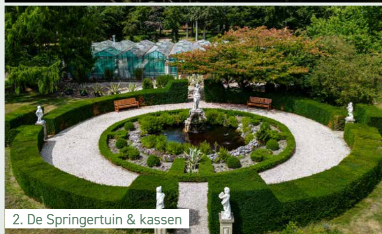
2. De Springertuin & kassen