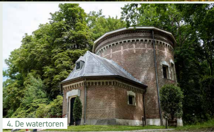
4. De watertoren