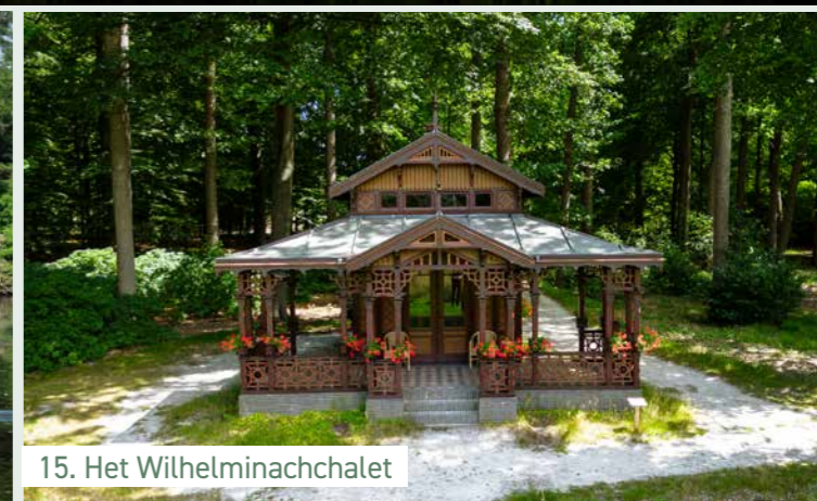
15. Het Wilhelminachalet